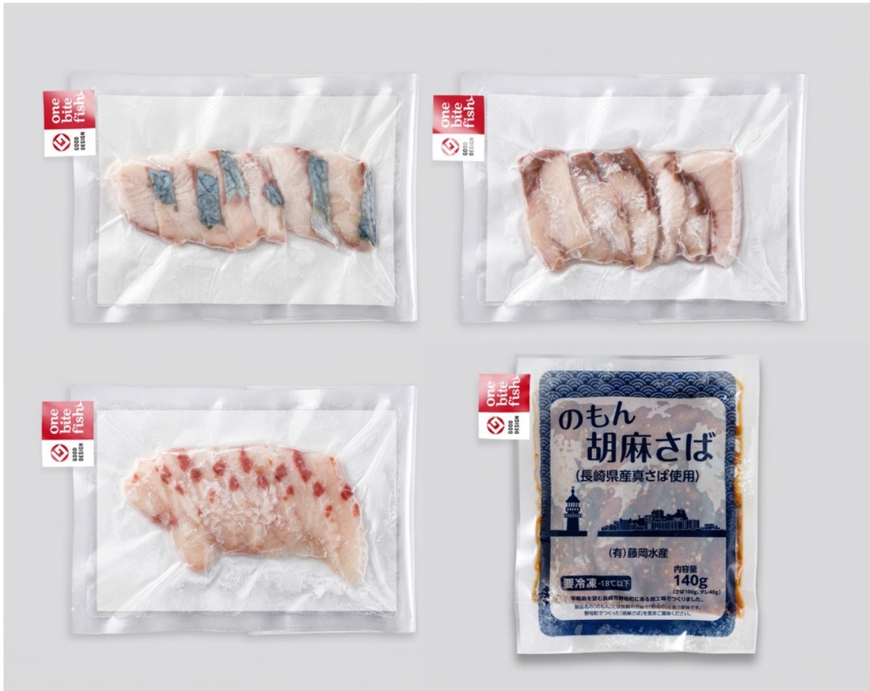
おさかな定期便 one bite fish 4パックコース