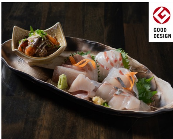
おさかな定期便 one bite fish 4パックコース 盛り付けイメージ