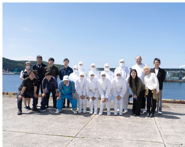
新体制を推進するパートナー各社・各団体のメンバー